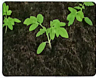
شكل الزهور الأولي للنبات